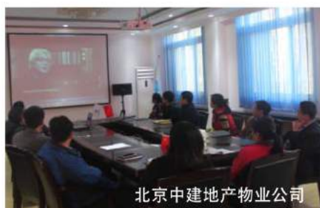
北京中建地产物业公司