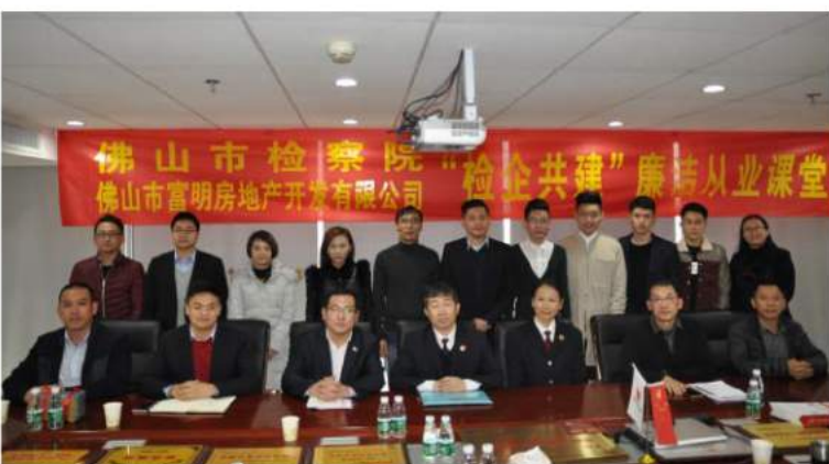
▲1月17日下午,深圳分公司富明地产公司联合佛山市检察院反贪局开展了“2017年,廉洁从业第一课”主题宣讲活动。(陈盈宇 赵勃)

通过开展此次活动,加强了员工廉洁自律意识,做到了自警、自醒、自律、自戒。(金利伟 刘萧琼祿)