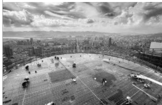
▲10月9日,局西南分公司昆明西山万达广场项目超高层塔机防水保护层的钢筋绑扎工作结束。

闲、商务办公等功能于一体,是深圳援疆喀什的标志性重点工程,全部建成后将成为带动丝绸之路经济带核心区快速发展、促进民族团结、推动对外开放的示范新城。