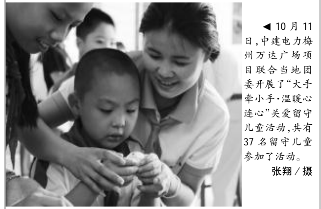
▲10月11日,中建电力梅州万达广场项目联合当地团委开展了“大手牵小手·温暖心连心”关爱留守儿童活动,共有37名留守儿童参加了活动。 张翔/摄