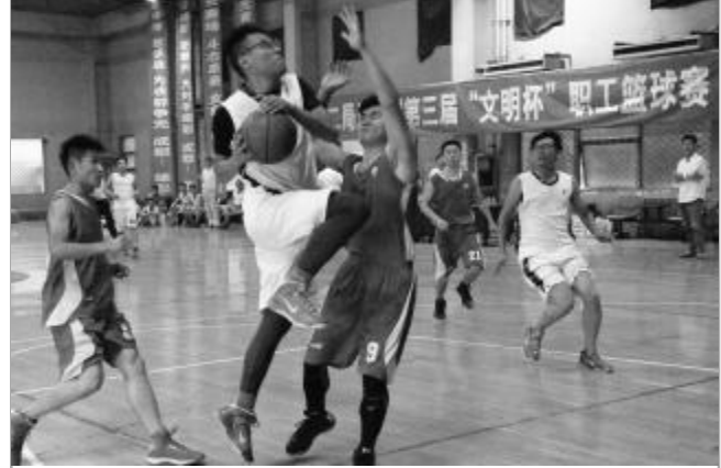
▲近日,三公司第三届“文明杯”职工男子篮球赛在京落下帷幕,武汉分公司夺冠。