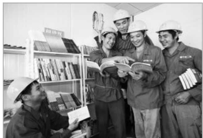
▲10月10日,四公司北辰半岛项目职工书屋正式面向工友全天开放,让大家可以随时自选图书。